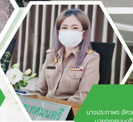
นางประภาพร อัครวิกรม นายกเทศมนตรี นครสมุทรปราการ