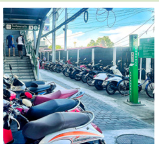
3 ปากซอยกองรักษาการณ์ โรงเรียนนายเรือ