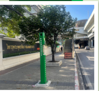
5 หน้าพระวิหารพระพุทธชินราช มณฑลปราการ