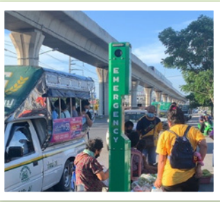
8 ทางขึ้นสถานีรถไฟฟ้า BTS แพรกษา ฟังห้างโรบินสัน