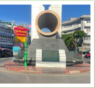
10 หน้าประติมากรรมห้วงจักร ตลาดปากน้ำ