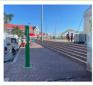
6 หน้าลานเครื่องออกกำลังกาย ศาลากลางจังหวัดสมุทรปราการ