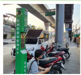
1 ปากซอย 7 อุดมเดช