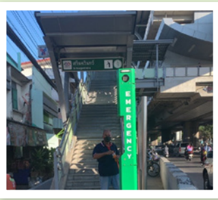
7 ปากซอยบางบึง ทางขึ้นสถานีรถไฟฟ้า BTS ศรีนครินทร์