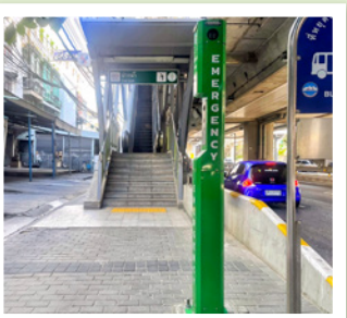
4 ทางเข้าศูนย์การค้าปากน้ำ