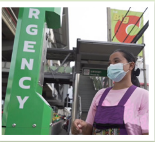
9 ทางขึ้นสถานีรถไฟฟ้า BTS แพรกษา บริเวณฟังห้างบิ๊กซี