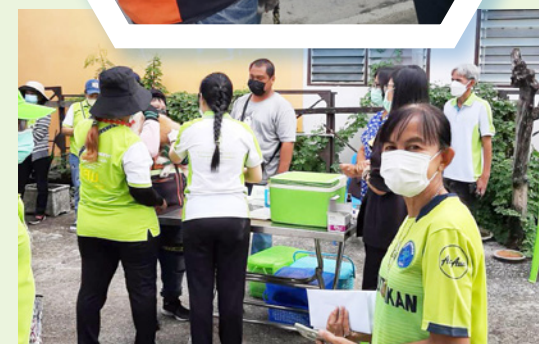
ชุมชนสายลวดสะพานสาม

ศูนย์บริการสาธารณสุข 2 (สะพานสาม) มาให้บริการด้านสาธารณสุขกับประชาชนภายในชุมชนต่างๆ อาทิ บริการให้คำปรึกษาในด้านการดูแลสุขภาพเบื้องต้น, บริการตรวจคัดกรองโรคเบาหวาน ความดัน และมะเร็งลำไส้ บริการฉีดวัคซีนป้องกันโรคไข้หวัดใหญ่ให้ผู้สูงอายุ และกลุ่มเสี่ยง เป็นต้น ทั้งนี้ เพื่อเป็นการดูแล สร้างภูมิคุ้มกันให้ประชาชนในพื้นที่ รวมถึงสัตว์เลี้ยง ปลอดโรค ปลอดภัย มีสุขภาพอนามัย ความเป็นอยู่และคุณภาพชีวิตที่ดี ■