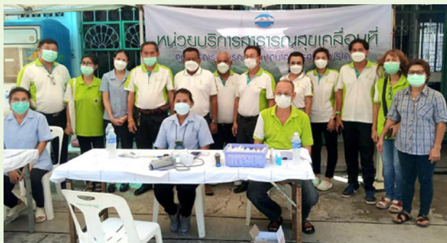
ชุมชนโรงนมตรามะลิ