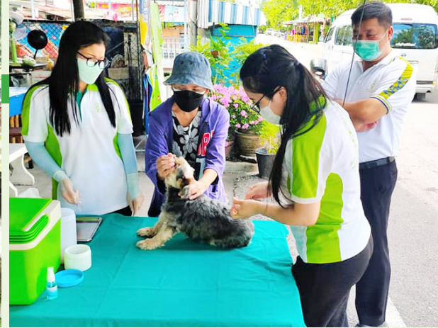
ชุมชนศูนย์การค้าปากน้ำ