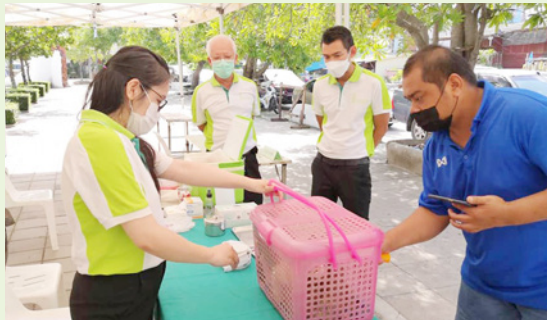
ชุมชนตรอกถ่าน