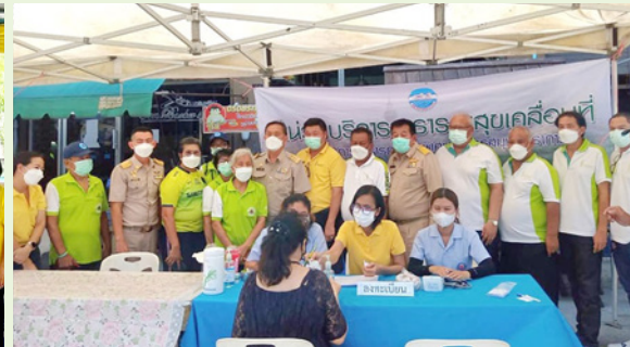
ชุมชนนารถสุนทร