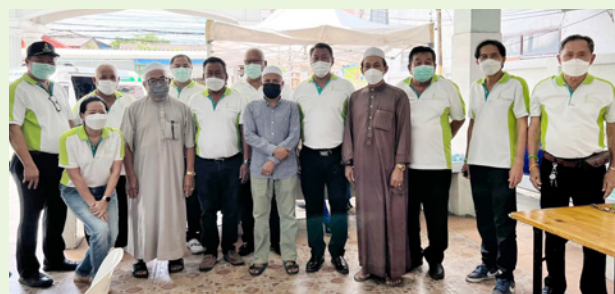
ชุมชนอักษรถักกลิ่น