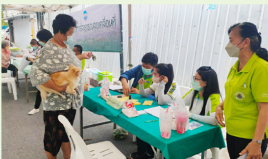
ตลาดปากน้ำ-ข้างสถานธนาอนุบาล เทศบาลนครสมุทรปราการ