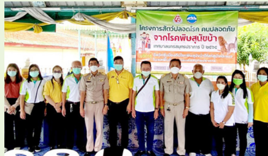
ชุมชนวัดกลาง (บ้านใหม่)