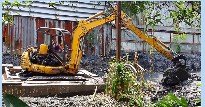
ขุดลอกคลองราฟาแอล บริเวณซอยหมู่บ้านศุภวิษ

และวัชพืชจำนวนมาก ทำให้ลำคลองตื้นเขินกีดขวางทางระบายน้ำ เมื่อดำเนินการแล้วเสร็จ จะช่วยให้การระบายน้ำออกทางประตูระบายน้ำคลองปากน้ำเป็นไปได้อย่างสะดวกและมีประสิทธิภาพมากขึ้น พร้อมทั้งดำเนินการขุดลอกคลองราฟาแอลนอกจากจะช่วยในเรื่องการระบายน้ำ ยังเป็นการปรับปรุงภูมิทัศน์และสภาพแวดล้อมให้สะอาดสวยงาม ซึ่งเทศบาลนครสมุทรปราการจะได้ทยอยขุดลอกคลองสายต่างๆต่อไปตามลำดับ ■