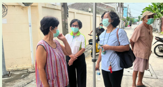
ชุมชนหมู่บ้านร่มเย็น