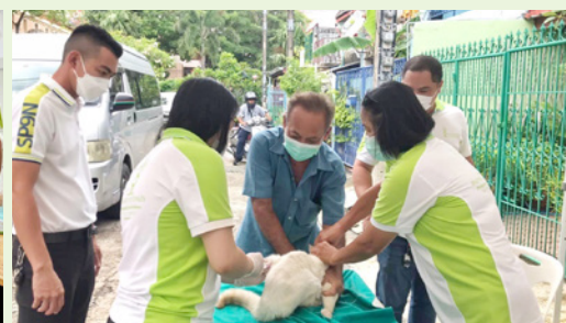
ชุมชนกองรักษาการณ์