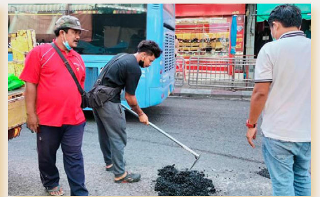
เจ้าหน้าที่ซ่อมแซมพื้นถนนในเส้นทางต่างๆ