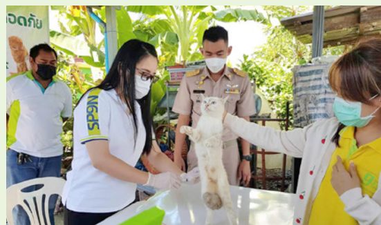
ชุมชนโค้งจรเข้