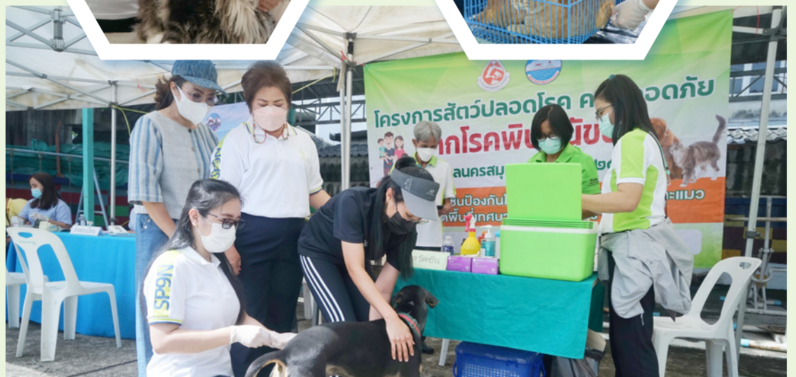
ชุมชนนาคทิมทอง

สำหรับในปีงบประมาณ 2565 คณะผู้บริหารเทศบาลนครสมุทรปราการ พร้อมด้วยสมาชิกสภาเทศบาลนครสมุทรปราการ, เจ้าหน้าที่กองสาธารณสุขและสิ่งแวดล้อม ได้นำหน่วยบริการฉีดวัคซีนป้องกันโรคพิษสุนัขบ้าเคลื่อนที่ ลงพื้นที่ฉีดวัคซีนให้แก่สุนัขและ