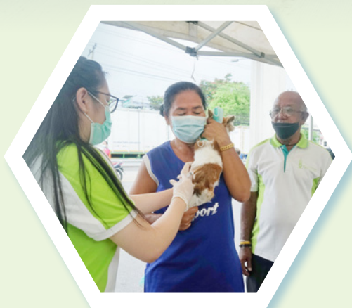
ชุมชนซอยโบราณ