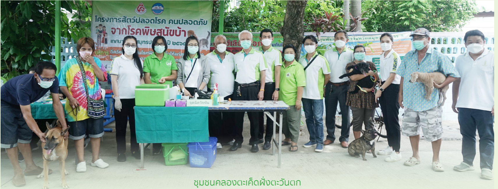
ชุมชนคลองตะเคียนฝั่งตะวันตก