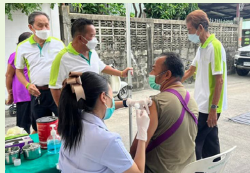
ชุมชนสายลวดซอย 3 (เจริญกุล)