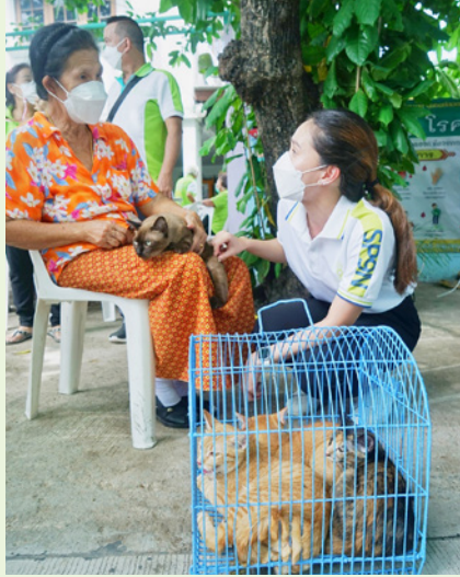
ชุมชนนาวิปากน้ำ