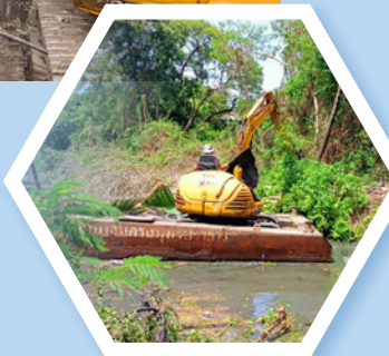
ขุดลอกคลองปากน้ำ