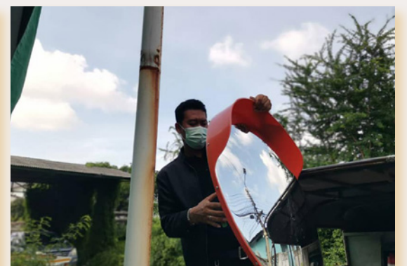
เปลี่ยนกระจกโค้งจราจร