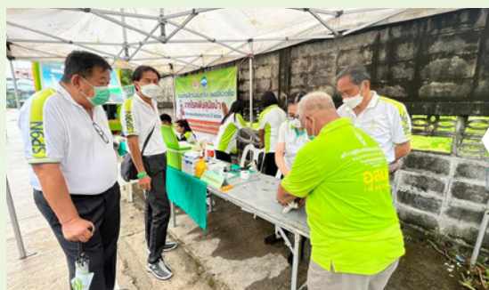
ชุมชนซอยเทศบาล 6 (บางนางเกรง)