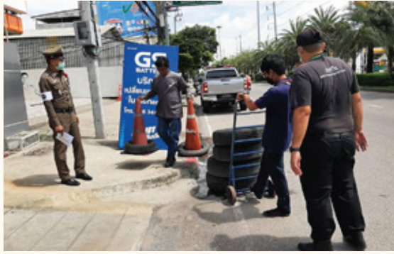
ลงพื้นที่ร่วมกับเจ้าหน้าที่ตำรวจจราจร ตรวจสอบข้อร้องทุกข์ กรณีมีผู้ตั้งวางวัสดุสิ่งของบนพื้นผิวจราจร