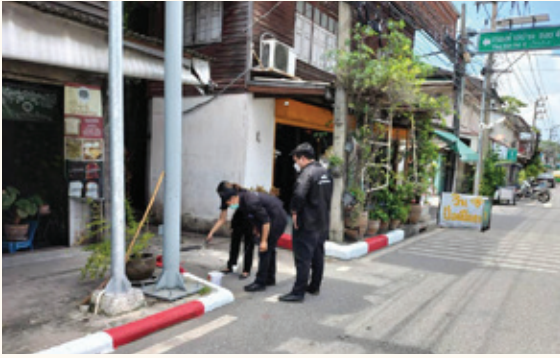
ตรวจสอบปัญหาขุดวางท่อระบายน้ำ-ออก และทาสีบังคับบนขอบทางยาว-แดง เพื่อให้เห็นบริเวณห้ามจอดได้อย่างชัดเจน