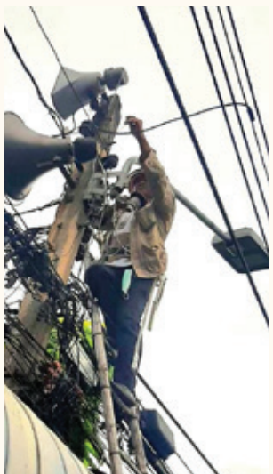
ตรวจสอบซ่อมบำรุงไฟแสงสว่างที่ชำรุด เพื่อให้ประชาชนสามารถใช้เส้นทางสัญจรไปมาได้โดยสะดวก