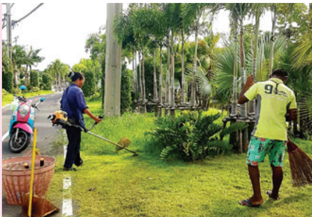
จัดแต่งสวนสาธารณะเฉลิมพระเกียรติโค้งบางปิ้ง

สำนักช่าง เทศบาลนครสมุทรปราการ ได้รับมอบหมายหน้าที่ในการดูแลแก้ไข และตรวจซ่อมสิ่งชำรุดต่างๆ เช่น ซ่อมไฟแสงสว่างให้สามารถใช้งานได้ตามปกติ มีแสงสว่างเพียงพอ ซ่อมปะยางมะตอยพื้นผิวถนนที่ชำรุด ให้ประชาชนใช้เส้นทางโดยสะดวก เปลี่ยนฝาท่อระบายน้ำให้อยู่ในสภาพที่ดี ซ่อมระบบไฟฟ้าหอนาฬิกา บริเวณวงเวียนท้ายบ้าน ให้สามารถแสดงผลข้อมูลวันเดือนปี เวลา และอุณหภูมิ ได้อย่างถูกต้อง เป็นต้น ทั้งนี้ คณะผู้บริหารได้กำชับให้การดำเนินการซ่อมแซมสิ่งต่างๆ ต้องทำทันที โดยเร็วที่สุด เพื่อให้ประชาชนดำรงชีวิตได้อย่างปกติสุขและมีคุณภาพชีวิตที่ดี ■