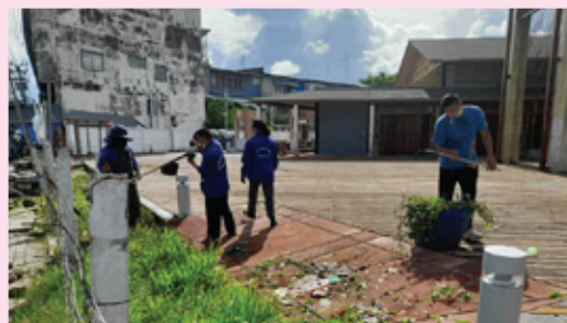
ตัดหญ้าและวัชพืช ชุมชนหัวน้ำวน และแนวทางเท้าถนนท้ายบ้าน