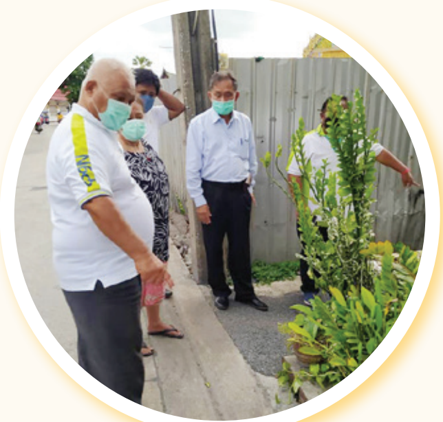
คณะผู้บริหารลงพื้นที่ตรวจสอบและรับฟังปัญหาจากประชาชน

ประชาชนสามารถยื่นเรื่องด้วยตนเองที่สำนักงานหอชมเมืองฯ, ส่งเป็นจดหมายทางไปรษณีย์ตอบรับ, แจ้งทาง e-mail เทศบาล, inbox เฟซเทศบาลนครสมุทรปราการ, แจ้งทางโทรศัพท์งานประชาสัมพันธ์ โทร. 0 2382 6140, ฝ่ายบริการและเผยแพร่วิชาการ โทร. 0 2382 6147 ในวันและเวลาราชการ, แจ้งผ่านเสารับแจ้งเหตุฉุกเฉินร้องเรียนร้องทุกข์ เสาส OS ทั้ง 10 จุดในเขตพื้นที่ตำบลปากน้ำ หรือแจ้งได้โดยตรงที่เจ้าหน้าที่ คณะผู้บริหาร หรือสมาชิกสภาเทศบาลนครฯ ที่ลงพื้นที่ให้การดูแลประชาชน