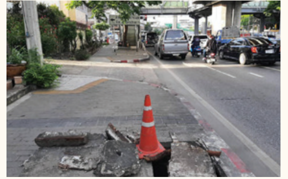
ประสานงานแขวงทางหลวงสมุทรปราการ กรณีการขุดเจาะและฝาปิดท่อระบายน้ำหลายจุดบนทางเท้า แนวถนนสุขุมวิทอยู่ในสภาพไม่เรียบร้อย