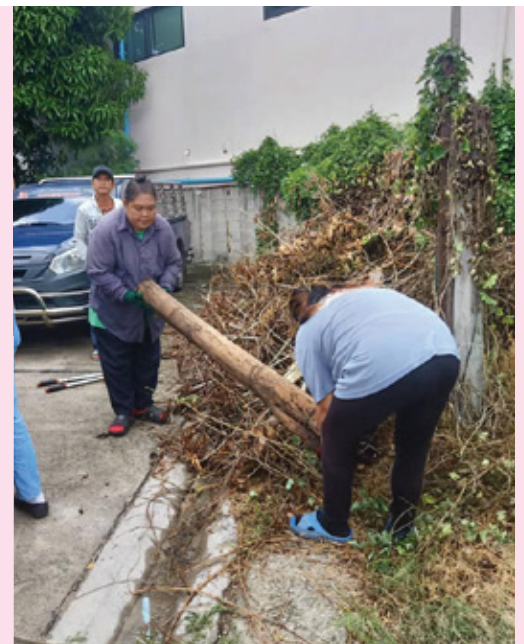
เก็บซากไม้แห้ง ซอยเจริญสุข ถนนจ๊กะพาก