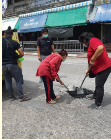
ซ่อมปะยางมะตอยพื้นผิวถนนที่ชำรุด ตลาดปากน้ำ