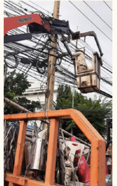
จัดระเบียบสายสื่อสารสายเคเบิลสายโทรศัพท์ที่ห้อยต่ำ เพื่อป้องกันไม่ให้เกิดอันตรายแก่ชีวิตและทรัพย์สิน