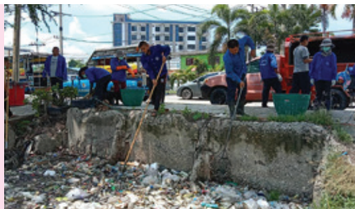
ตักเก็บขยะ คลองโรงยา ถนนท้ายบ้าน