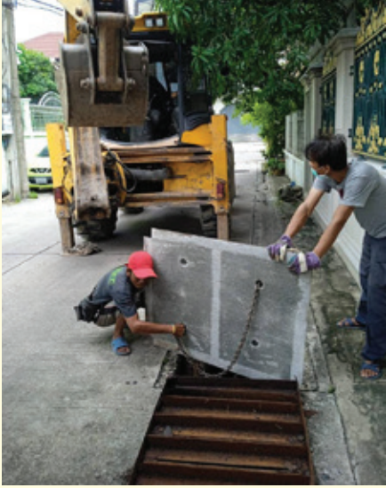
เปลี่ยนฝาปิดท่อระบายน้ำหน้าวัดกลางวรวิหาร และถนนท้ายบ้านซอย 17