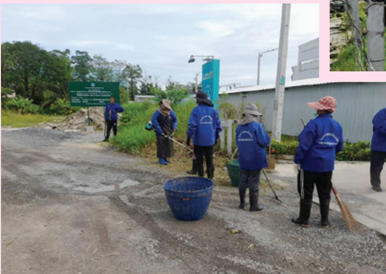
ทำความสะอาดถนนท้ายบ้าน ซอยข้างธนาคารไทยพาณิชย์