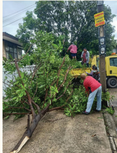
ตัดแต่งกิ่งไม้ไม่ให้ยี่งอใกล้สายไฟ และยื่นล้ำเข้าไปในบ้านเรือนประชาชน และป้องกันการเกิดวางหรือบดบังทัศนวิสัย

นายธนเสฏฐ์ อุดมวงค์ยนต์ รองนายกเทศมนตรีนครสมุทรปราการ เปิดเผยข้อมูลว่า กระบวนการจัดการเรื่องร้องเรียนร้องทุกข์ เทศบาลนครฯ จะดำเนินการตรวจสอบข้อมูลและจำแนกเรื่องเพื่อนำมาพิจารณา โดยเรื่องร้องเรียนจะแบ่งออกเป็น 3 กรณีหลัก คือ หนึ่ง, กรณีที่ไม่อาจรับไว้พิจารณา ได้แก่ บัตรสนเท่ห์ที่ไม่สามารถระบุหลักฐานชัดเจน และกรณีที่อยู่ระหว่างการพิจารณาของศาลหรือมีคำสั่งเด็ดขาดแล้ว สอง, คือ กรณีที่ดำเนินการแก้ไขได้ทันที ก็จะทำการแก้ไขและแจ้งผลให้ผู้บังคับบัญชาทราบ และสาม, คือกรณีที่ต้องส่งให้หน่วยงานที่เกี่ยวข้องตรวจสอบแก้ไข