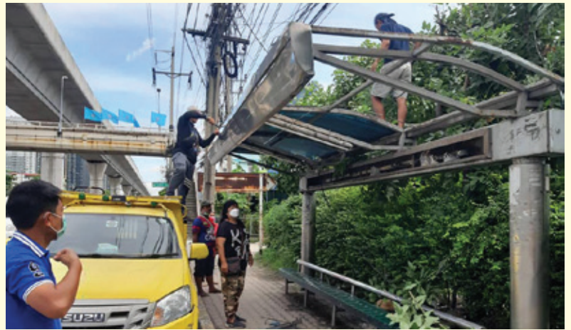
ซ่อมเปลี่ยนหลังคาศาลาที่พักผู้โดยสาร ป้ายรถประจำทางหน้าโรงเรียนพณิชยการวัดราชบูรณะ