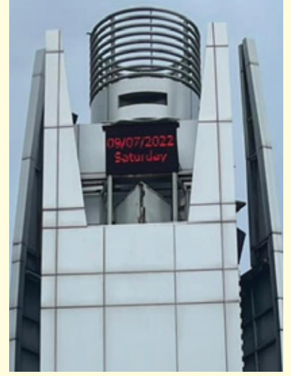
ซ่อมระบบไฟฟหอนาฬิกาวงเวียนท้ายบ้าน