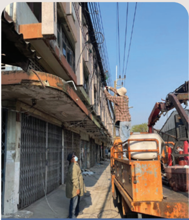
ถนนและชุมชนท้ายบ้าน 40