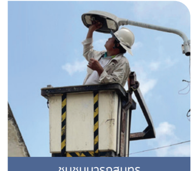
ชุมชนนารถสุนทร