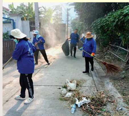
ถนนสุขุมวิทซอย 39 (จักรศรี)