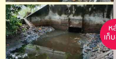
หลังเก็บขยะ