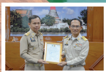
รับเกียรติบัตรการรับรองคุณภาพ ระบบบริหารอนามัยสิ่งแวดล้อม (EHA)