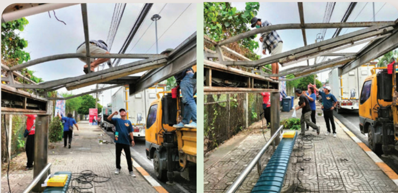
ป้ายรถประจำทางบริเวณถนนสายลวด