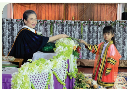
โรงเรียนเทศบาล 4 (สิทธิไชยอุปถัมภ์)

ทั้งนี้ ตามนโยบายส่งเสริมด้านการศึกษา คณะผู้บริหารเทศบาลนครสมุทรปราการ พร้อมสนับสนุนส่งเสริมคุณภาพการศึกษาและพัฒนาศักยภาพของเด็กและเยาวชนในทุกด้านอย่างต่อเนื่อง เพื่อประสิทธิผลและประสิทธิผลที่ดีทางการศึกษา ให้เด็กและเยาวชนของเทศบาลนครสมุทรปราการเติบโตเป็นคนดีและคนเก่งของชุมชน สังคม และประเทศชาติต่อไป ■