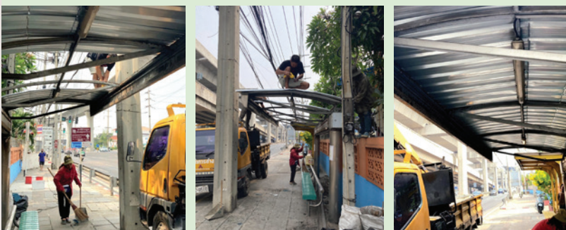
แยกการไฟฟ้า ถนนสุขุมวิท