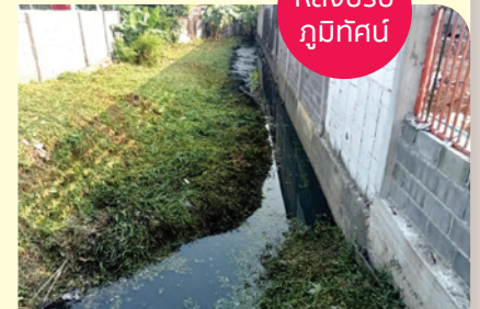
หลังปรับปรุงภูมิทัศน์