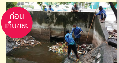
ก่อนเก็บขยะ