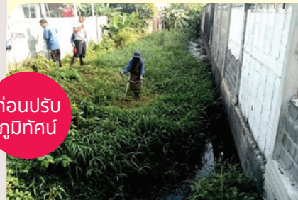
ก่อนปรับปรุงภูมิทัศน์

เพื่อปรับปรุงสภาพแวดล้อมในพื้นที่ให้มีความสะอาด เป็นระเบียบเรียบร้อย ไม่เป็นแหล่งสะสมเชื้อโรคหรือที่อยู่อาศัยของสัตว์มีพิษ กองสาธารณสุขและสิ่งแวดล้อม เทศบาลนครสมุทรปราการ ได้เข้าดำเนินการพัฒนาปรับปรุงพื้นที่ ในหลายจุด อาทิ เก็บกวาดขยะ กำจัดวัชพืช ปรับภูมิทัศน์บริเวณถนนสุขุมวิท ซอย 39 (จักรศรี), ทำความสะอาด ตัดหญ้าและวัชพืชในคลองร่มเย็น ซอยเพิ่มเติม และเข้าช้อนตักเก็บขยะในคลองหิน เพื่อให้เกิดความสะอาด การระบายน้ำเป็นไปโดยสะดวก ■