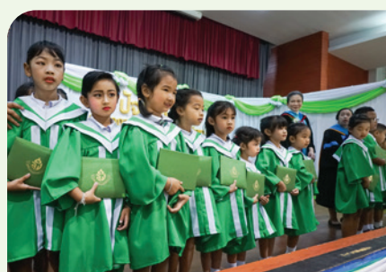
โรงเรียนอนุบาลเทศบาลนครสมุทรปราการ