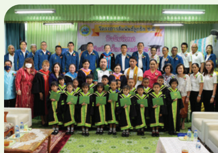
โรงเรียนเทศบาล 5 (วัดกลางวรวิหาร)