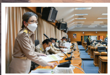
ประชุมสภาสามัญสามัญ สมัยที่ 1 ประจำปี พ.ศ. 2566