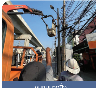
ชุมชนบางปิ้ง

สำนักช่าง เทศบาลนครสมุทรปราการ เข้าดำเนินการซ่อมแซมเปลี่ยนหลอดไฟส่องสว่างทางสาธารณะในหลายพื้นที่ อาทิ ชุมชนนารถสุนทร, ถนนจ๊กกะพาก, ชุมชนบางปิ้ง พร้อมทั้งเก็บจัดระเบียบสายสื่อสารที่ห้อยต่ำลงพื้น ป้องกันไม่ให้เกิดอันตรายแก่ประชาชน รวมถึงยวดยานพาหนะที่สัญจรผ่านไปมา ในหลายจุด อาทิ ถนนและชุมชนท้ายบ้าน 40, ถนนอมรเดช โดยหลังจากนี้จะได้ประสานไปยังหน่วยงานเจ้าของสายสื่อสารให้รับทราบและดำเนินการแก้ไข เพื่อป้องกันไม่ให้เกิดปัญหาในระยะยาวต่อไป ■