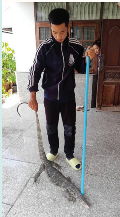
ถนนสายลวดซอย 3 (เจริญกุล)

งานป้องกันและบรรเทาสาธารณภัย เข้าดำเนินการจับสัตว์เลื้อยคลานภายในที่พักอาศัยของประชาชนตามที่ได้รับแจ้งขอความช่วยเหลือ อาทิ บริเวณถนนสายลวดซอย 3 (เจริญกุล), ชุมชนวัดชัยมงคล เพื่อไม่ให้เป็นอันตรายต่อประชาชน พร้อมประสานหน่วยงานที่เกี่ยวข้องนำไปปล่อยคืนสู่ธรรมชาติ โดยสามารถแจ้งเหตุขอความช่วยเหลือได้ที่ โทร. 0 2389 1010 และ 0 2389 1015 ตลอด 24 ชั่วโมง ■