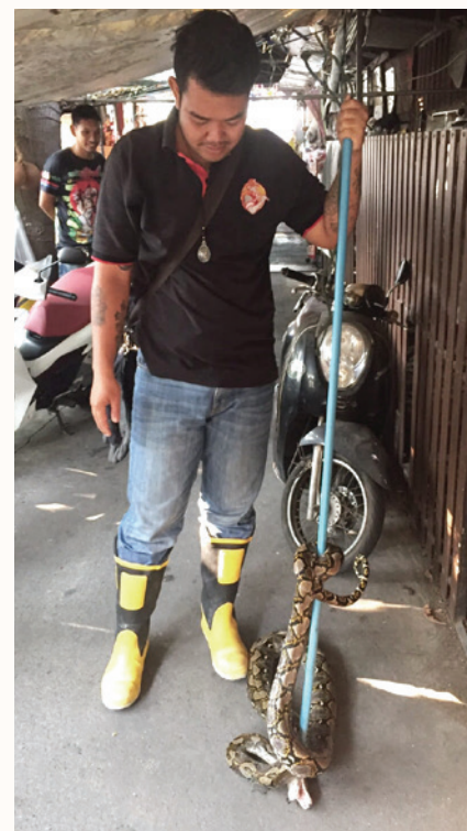
ชุมชนวัดชัยมงคล