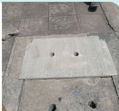
ถนนสายลวด ซอย 6