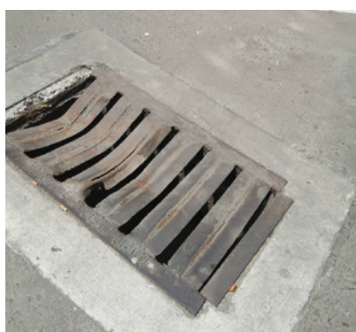
ถนนประโคนชัยหน้าสถานีตำรวจภูธรเมืองสมุทรปราการ