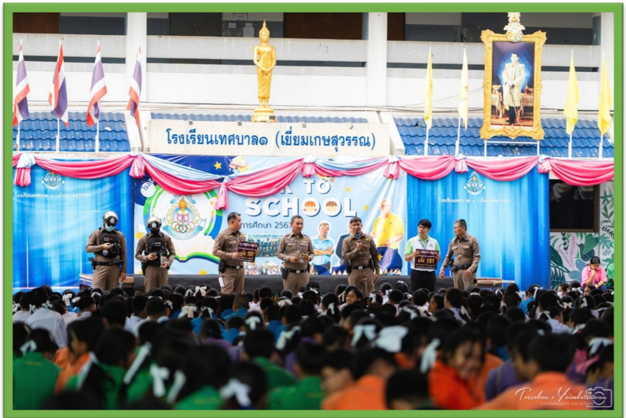
อบรมความปลอดภัย จาก ตำรวจ สถานีตำรวจภูธร จังหวัดสมุทรปราการ