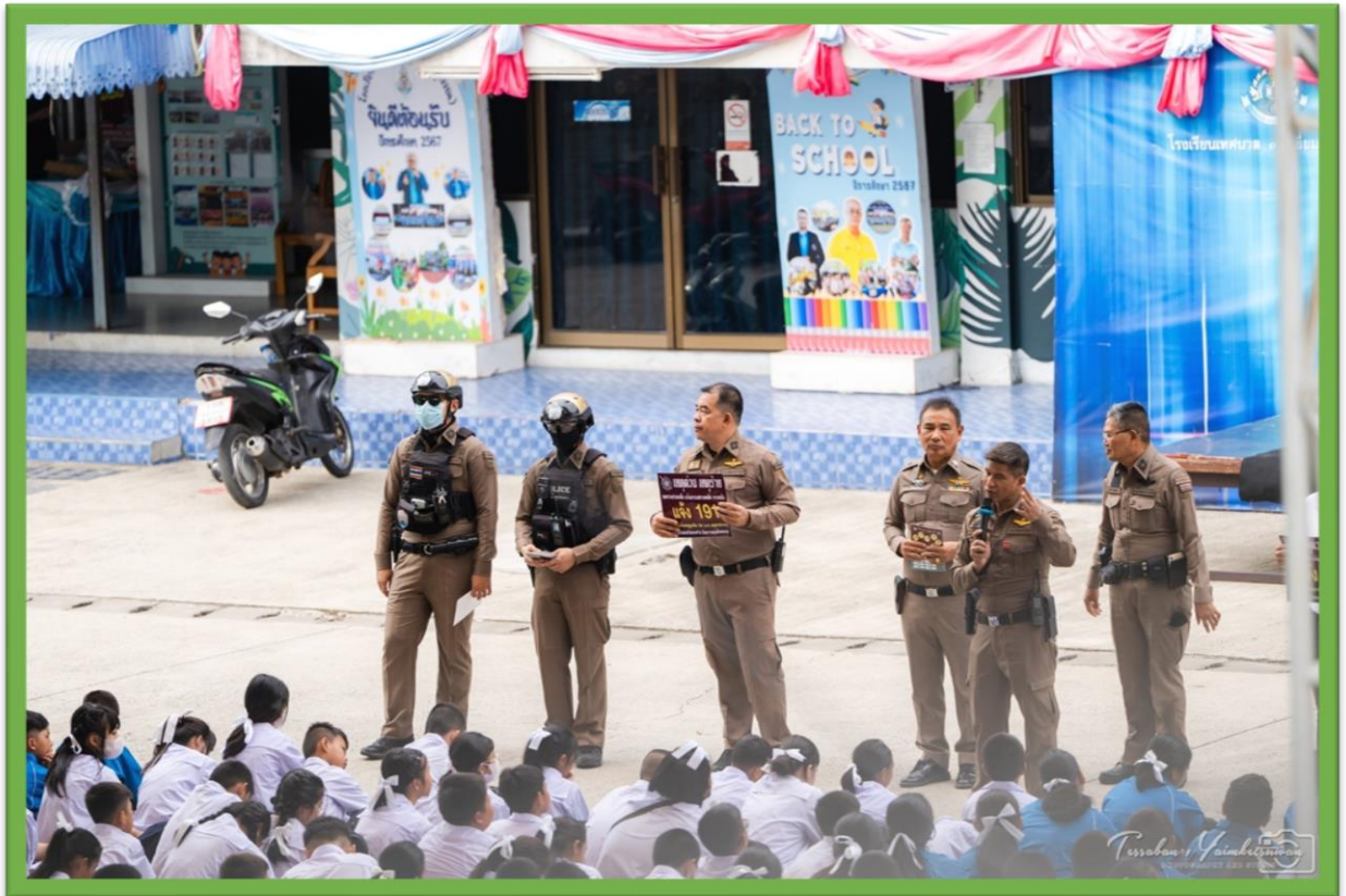
อบรมความปลอดภัย จาก ตำรวจ สถานีตำรวจภูธร จังหวัดสมุทรปราการ